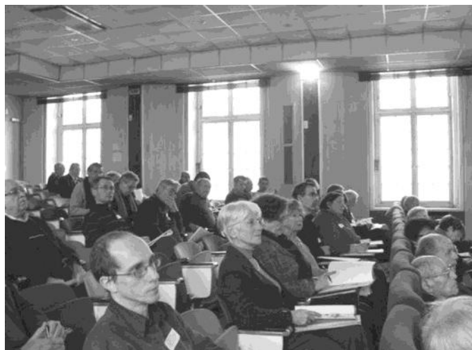
L'amphithéâtre Louis de l'Ecole militaire, lors de la journée d'étude du 16 janvier 2010.