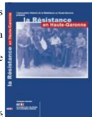
Jaquette du cédérom « La Résistance en Haute-Garonne ».

La présentation du cédérom La Résistance dans le Gard a eu lieu le 15 mai à l'École des Mines d'Alès. Le cédérom a été accueilli chaleureusement.