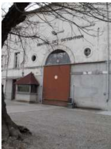
Entrée de la prison d'Eysses. Lors du tournage de la visite virtuelle.

Une exposition thématique sur la Centrale d'Eysses (Lot-et-Garonne) est en cours de réalisation. Elle évoquera la détention par le régime de Vichy de plus de 1400 résistants de toute la France dans cette prison, autour des traces qu'elle a laissées. L'internaute y trouvera :