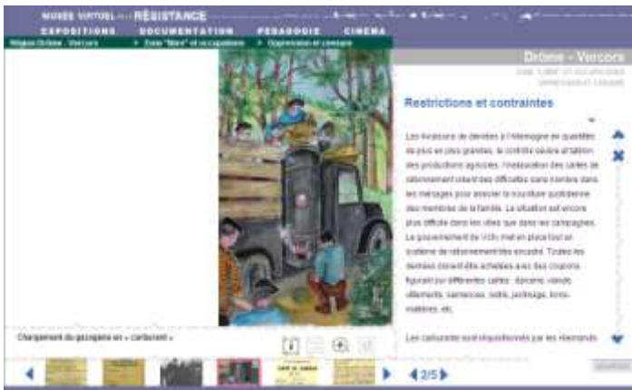
Exposition virtuelle Drôme-Vercors (extrait)