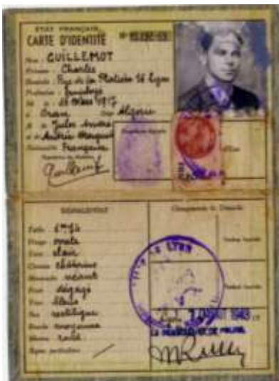
Fausse carte d'identité de S. Ravanel. Août 1943.

L'organisation des groupes-francs a inscrit à son actif de nombreuses opérations importantes, comme la libération de Raymond Aubrac le 21 octobre 1943 ou encore la destruction du dépôt de munitions allemand de Grenoble le 13 novembre 1943.