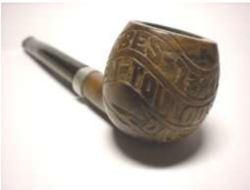
Pipe sculptée de J. Belloni. coll. F Bourrée, DR.